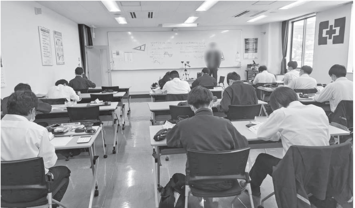
▲電験三種の講義風景。新入職員は対面式で、そのほかの受験者はオンラインで受講する。外部講師を招いた講義で4科目を徹底的に学ぶ。