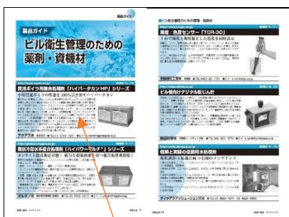
製品・サービスガイド (1/3 頁)