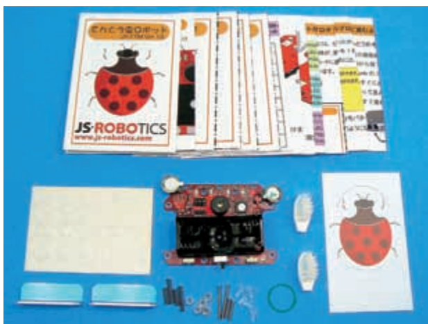
キットの部品一覧。部品と資料類がコンパクトにまとまっている。