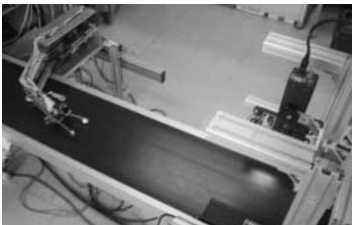
写真2：ベルトコンベア上の物体をつかむ高速ハンドリングシステム