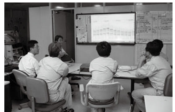
写真1 設備お悩み解決委員会の風景

設備お悩み解決委員会の参加メンバーは、設備の設計施工ノウハウを持つ人と設備運用のノウハウを持つ者で構成し、委員会の話し合い(写真1)では、メンバー自身の経験や知見に基づき、運用状況の見える化を図り、設備システムの理解を深め、解析的アプローチ、設計的アプローチの両面から検証しながら、メンバー相互の「ワイガヤ(ワイワイガヤガヤの略)」の中で、ベストな、事例に