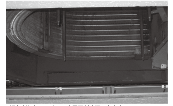
汚れがとれ、coilの金属面が確認できます。

また、coilに付着していた塵埃がなくなったため、居室の浮遊粉塵量が洗浄前に比べ55%減少しました。