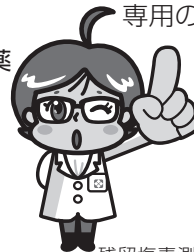
残留塩素測定器 DPD法