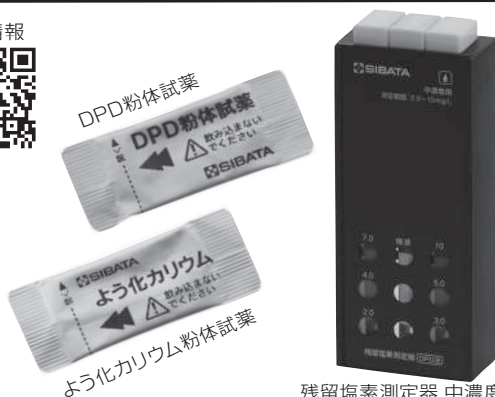
残留塩素測定器 中濃度用