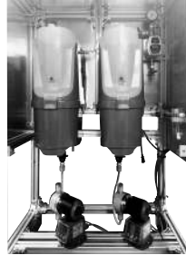
専用溶解装置 ソリッドマイガード