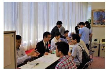
講師への相談コーナー