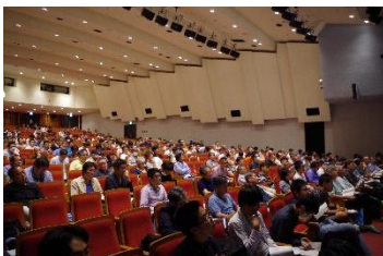
当日の会場の様子