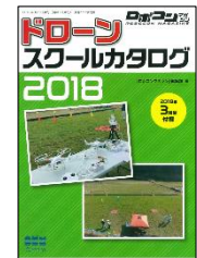
2018年3月号特別付録 ドローンスクールカタログ 2018