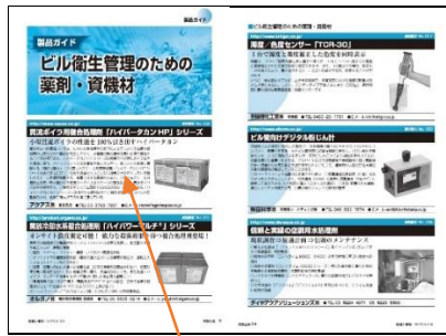
製品・サービスガイド (1/3 頁)