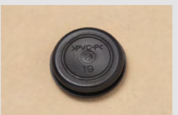
▲No.36 ゴムプッシング (19) ※5