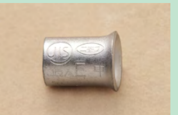
▲No.39 リングスリーブ (中)