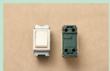
▲No.18 埋込連用タンブラスイッチ (3路用)