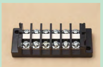
▲No.30 端子台 6極 (リモコンリレーの代用) ※2