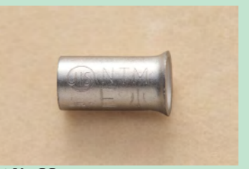
▲No.38 リングスリーブ (小)