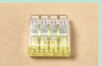
▲No.42 差込形コネクタ (4本用) ※6

※1 カバー付きてお届けします。カバーを外してご利用ください。 ※2 端子台端子番号は、マジック等で記入してご利用ください。 ※3 アウトレットボックスの打ち抜きは、ベンチ等でお願いします。 ※4 止めねじは、ねじ切った後に残った頭の部分をベンチなどで回すことにより、外せます。付属品を含む2回分を同梱しています。 ※5 13回×1回を一通り切り込みを入れる個数でのお届けになります。 ※6 電線の取り外しは、差込形コネクタをひねりながら引き抜いてください。1問ごとに再利用してください。 ★ 器具の仕入れ状況により、一部の器具につきまして一覧の写真と外観等が異なる場合がございます。施工の方法は変わりませんので、そのままお使いいただけますようお願い致します。