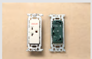
▲No.24 埋込連用コンセント (20A250V 接地極付)