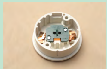
▲No.15 引掛シーリング (ボディ丸形)