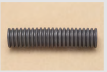
▲No.32 合成樹脂製可とう電線管 (PF16) 約 70mm