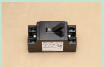
▲No.27 配線用遮断器 (100V 2極 1素子)