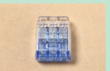
▲No.41 差込形コネクタ (3本用) ※6