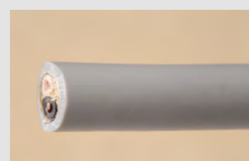
▲No.10 600V ビニル絶縁ビニルシースケーブル 丸形 1.6mm 2心