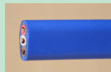
▲No.06 600V ビニル絶縁ビニルシースケーブル 平形 2.0mm 3心 青