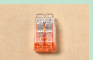
▲No.40 差込形コネクタ (2本用) ※6