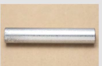
▲No.34 ねじなし電線管 (E19) 約 120mm