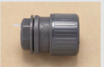
▲No.33 合成樹脂製可とう電線管用コネクタ (PF16)