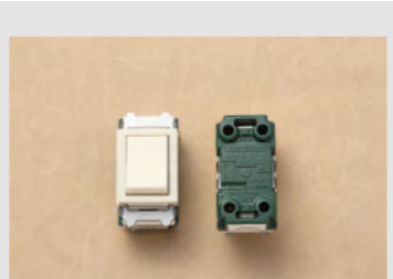
▲No.19 埋込連用タンブラスイッチ (4路用)