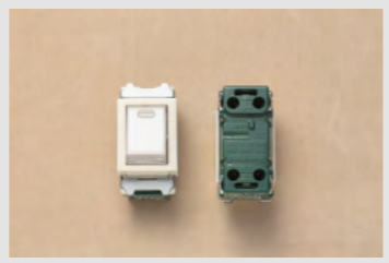
▲No.20 埋込連用タンブラスイッチ (位置表示灯内蔵)