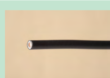
▲No.01 600V ビニル絶縁電線 1.6mm (黒)