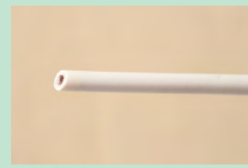
▲No.02 600V ビニル絶縁電線 1.6mm (白)