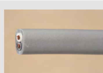
▲No.07 600V ビニル絶縁ビニルシースケーブル 平形 1.6mm 2心