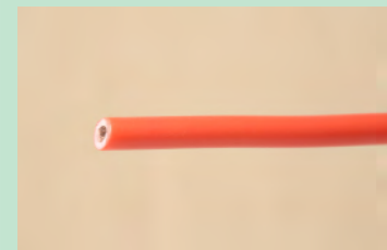
▲No.03 600V ビニル絶縁電線 1.6mm (赤)