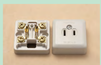
▲No.16 露出形コンセント ※1