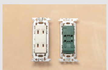
▲No.22 埋込連用コンセント (2口)