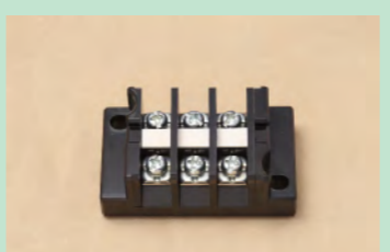
▲No.28 端子台 3極 (自動点滅器の代用) ※2