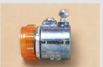
▲No.35 ねじなしボックスコネクタ (E19用) (絶縁プッシング、ロックナット付き) ※4