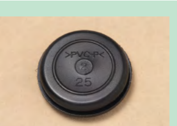
▲No.37 ゴムプッシング (25) ※5