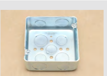
▲No.31 ジョイントボックス (アウトレットボックス) ※3