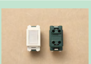
▲No.25 埋込連用パイロットランプ