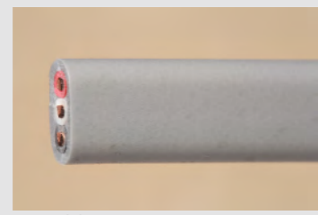
▲No.08 600V ビニル絶縁ビニルシースケーブル 平形 1.6mm 3心