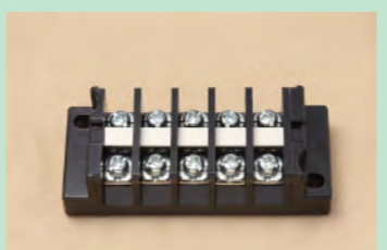
▲No.29 端子台 5極 (配線用遮断器、漏電遮断器、 接地端子等の代用) ※2