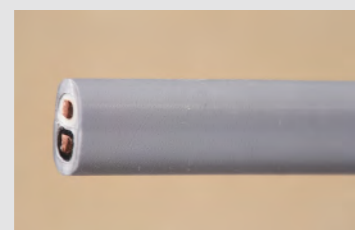
▲No.12 600V ポリエチレン絶縁耐燃性 ポリエチレンシースケーブル 平形 2.0mm 2心