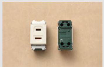
▲No.21 埋込連用コンセント