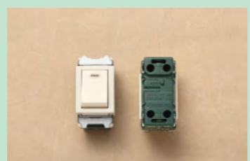
▲No.17 埋込連用タンブラスイッチ