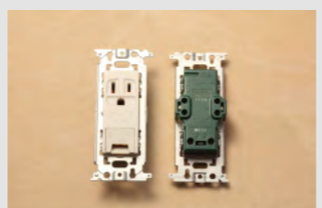
▲No.23 埋込連用コンセント (15A125V 接地極付接地端子付)