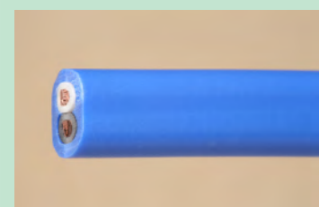
▲No.05 600V ビニル絶縁ビニルシースケーブル 平形 2.0mm 2心 青