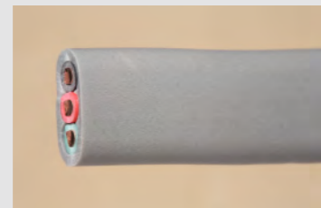
▲No.09 600V ビニル絶縁ビニルシースケーブル 平形 2.0mm 3心 黒赤緑