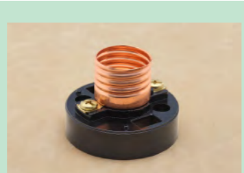
▲No.13 ランプレセプタクル ※1