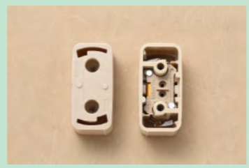
▲No.14 引掛シーリング (ボディ角形)