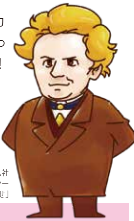
オーム社 営業キャラクター 「オームはかせ」