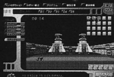
▲「競技会場」。自分で作ったロボットと、ほかの参加者が作ったロボットを対戦させよう。勝利するとポイントが加算される。