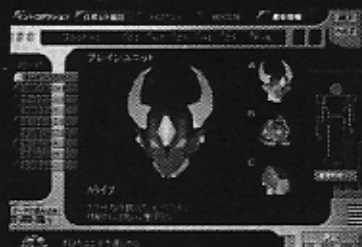
▲「ロボット組立&プログラム」。参加用ソフトを使ってロボットを作成。自分だけのロボットを作り出そう。