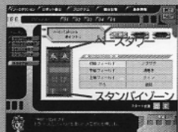
▲初級から上級まで、たくさん用意された競技フィールド。

「フィールド」とは競技コースのこと。フィールド全体は壁に囲まれている。ロボットは「スタンバイゾーン」からスタート、「ベースタワー」のゴールを目指し、そのタイムを競う。そして、途中の「メイズゾーン」には、障害物が待ちうけている。障害物には、「山状」「壁状」「砂地状」「トンネル状」「スパイク状」の5種類がある。