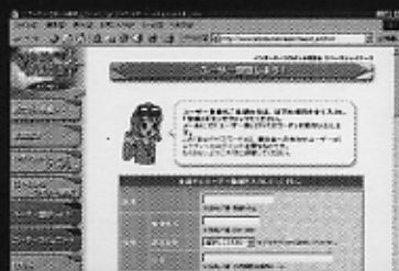
▲「ユーザー登録」。まず、公式Webサイトでユーザー登録して、「ユーザーID」と「パスワード」を入手。ログイン後、「ユーザーコミュニティ」から新しい参加用ソフトをダウンロードしよう。

この「スペースジョイナーズ2」は、誰でも自由に参加できる。特別な利用料はからず、参加用ソフトは無償で配布されているのが嬉しい。