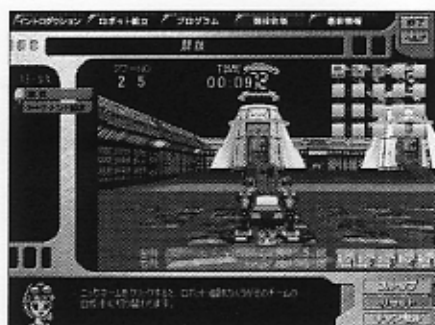
▲ポイント制・ランキング制など、新フィーチャーを引っさげて「スペースジョイナーズ」がリニューアル!

なお、参加用ソフトは今回のリニューアルで、一新されているため、最新版をインストールし直す必要がある。あと、ロボット・データは、新しく作り直したほうがよさそうだ (一応、前回用のデータファイルは読