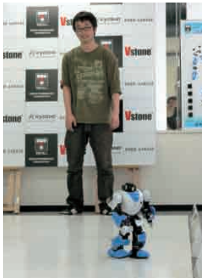
京商が主催する「公式記録会」でのコマ。写真のように、オペレーターが何も操作せずに5mを走りきる自律部門が用意されている。